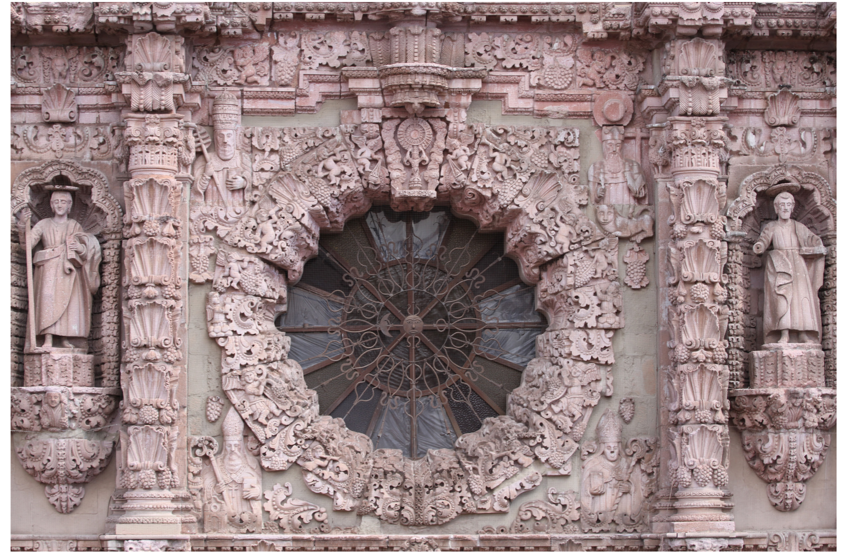
Ventana coral "Rosetón" del frontispicio de la Catedral de Zacatecas. S.XVIII.