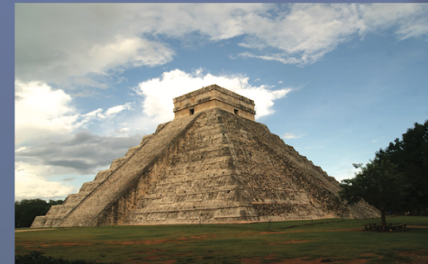
Ciudad Prehispánica de Chichén Itzá, México

To fulfill its mission, the RWHIZ provides technical assistance and training to the States Parties to the Convention that are in its area of interference; works closely with other national and international institutions, designing and applying training tools such as courses, workshops and regional meetings around UNESCO's capacity building strategy; promotes research on cultural and natural assets and disseminates good practices associated with the management of sites included in the World Heritage List and in the Tentative Lists of the countries of the region.