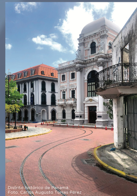
Distrito histórico de Panamá