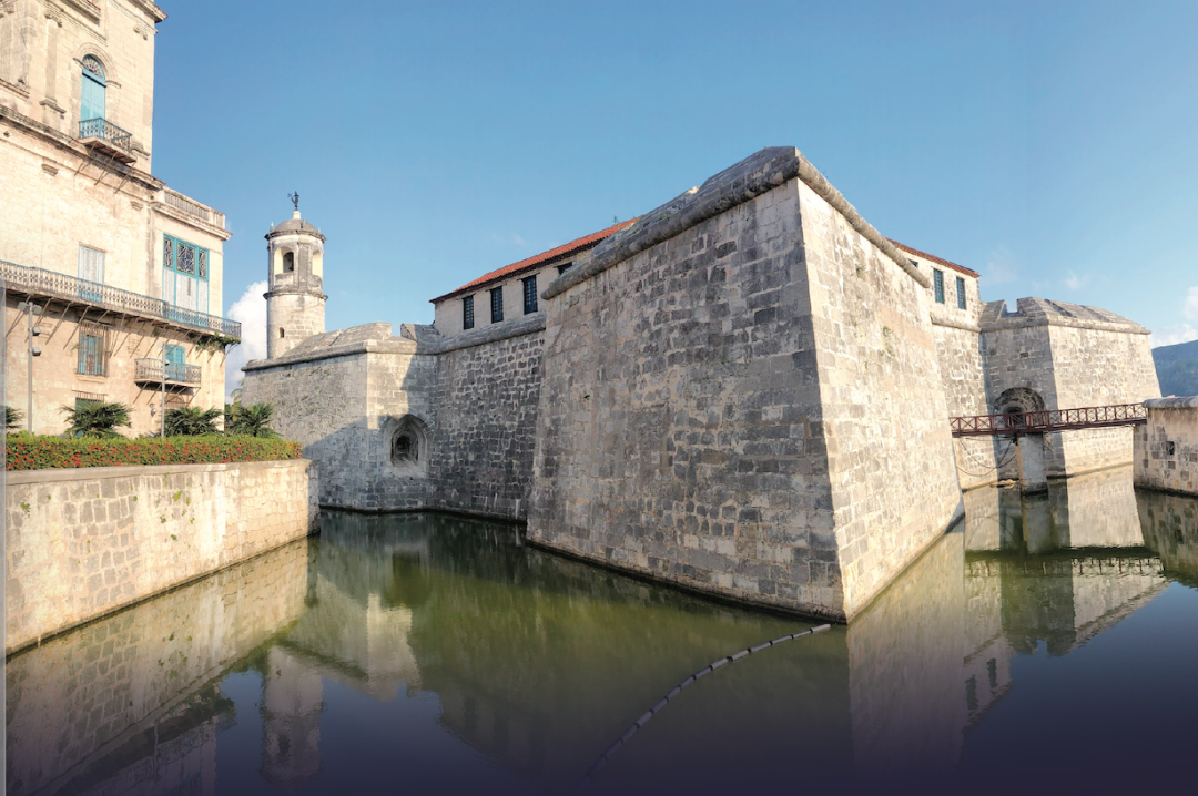
Ciudad vieja de La Habana y su sistema de fortificaciones, Cuba