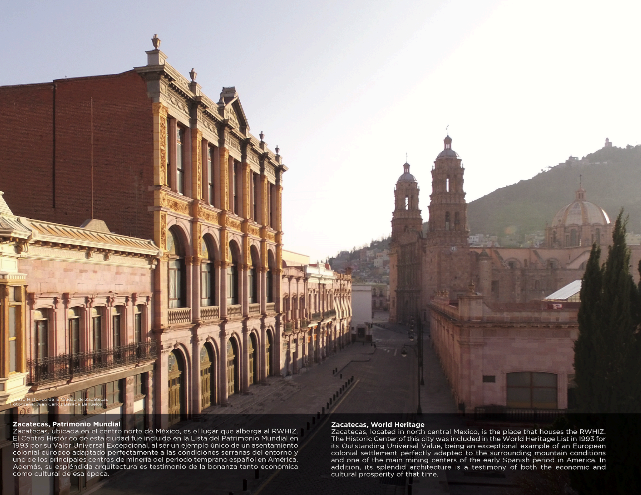
Centro Histórico de la Ciudad de Zacatecas