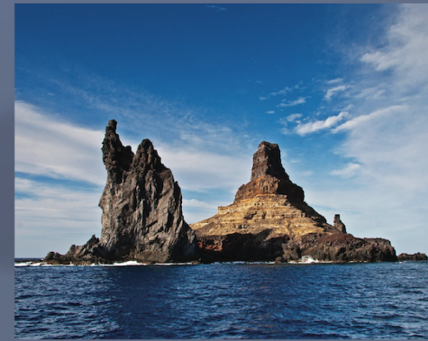
Archipiélago de Revillagigedo, México